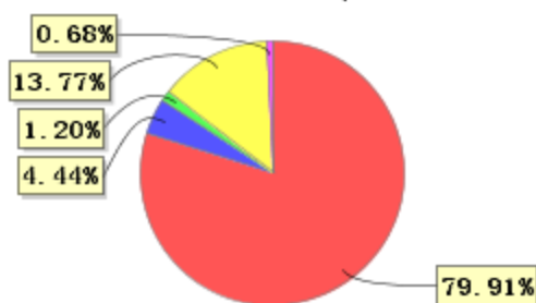
投资组合资产配置图表 (2021年3月31日)

● 固定收益投资 ● 买入返售金融资产 ● 其他各项资产 ● 权益投资 ● 银行存款和结算备付金合计