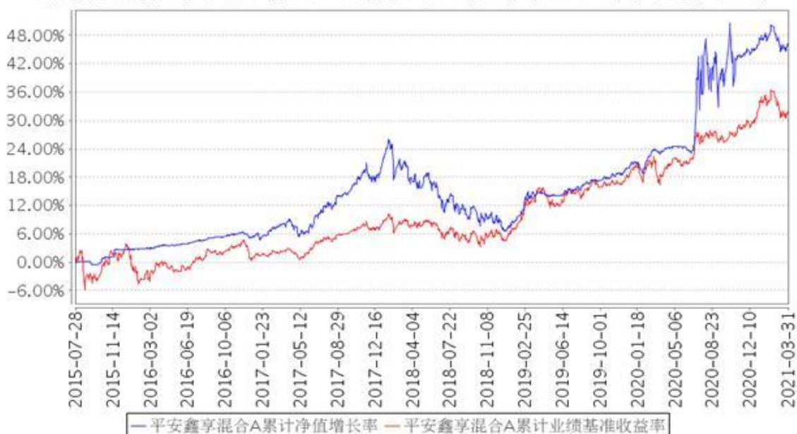
平安鑫享混合A累计净值增长率与同期业绩比较基准收益率的历史走势对比图