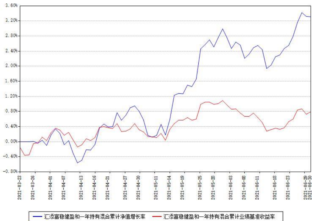
汇添富稳健盈和一年持有混合累计净值增长率与同期业绩基准收益率对比图