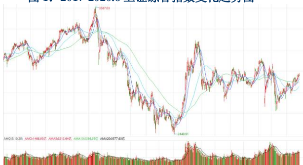
图 1：2017-2020.6 上证综合指数变化趋势图

证券行业与宏观经济环境高度相关。2016 年底，中央经济工作会议定调，要稳中求进、去杠杆，大力发展实体经济，2017 年 A 股出现慢牛格局。2017 年全年，上证指数全年振幅 13.98%，截至 2017 年末，上证综指收盘收于 3,307.17 点，较年初上涨 6.56%。2018 年，受中美贸易战、国内经济增速放缓等内外部因素影响，上证综指震荡下跌，截至 2018 年末，上证综指收盘于 2,493.90 点，较年初下跌 24.59%。2019 年以来，国内财政政策整体趋于宽松，市场情绪回暖，风险偏好提升，但结构性问题依然存在，国内外环境呈现不确定性，A 股市场一季度呈现活跃，之后由于受到国内外宏观因素的影响出现持续波动，但市场行情总体回暖，截至 2019 年末，上证综指收于 3,050.12 点，较上年末涨幅 22.30%。2020 年上半年，中央、各部委出台的多项重大政策应对经济下滑带来的负面影响，涵盖货币政策、金融改革、区域经济发展规划以及各项经济扶持刺激政策，这些政策的推出对促进国内经济发展均具有重大影响，同时，对资本市场也产生一定影响。上半年 A 股市场交投持续活跃，两市日均成交额达 7,579.72 亿元，总成交额合计 88.68 万亿元，同比增长 27.95%。截至 2020 年 6 月末，上证综指收于 2984.67 点，较上年末小幅下降 2.15%，但深成指以及创业板指均较上年末有所上涨。